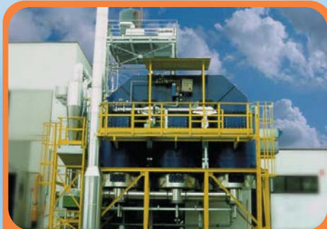
Combustore rigenerativo a 3 camere abbattimento SOV 3 chambers regenerative combustion plant for VOC treatment