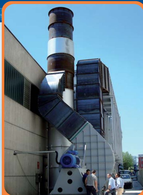
Filtro a maniche 200.000 m 3 /h abbattimento polveri da acciaieria 200.000 m 3 /h baghouse filter for steelworks dusts treatment

IMPIANTO ABBATTIMENTO COV E POLVERI DA RAFFREDDAMENTO FORME POST-COLATA NEL RISPETTO DELLA DIRETTIVA IPPC TREATMENT PLANT FOR COV AND DUSTS FROM POST-CASTING COOLING ACCORDING TO IPPC DIRECTIVE