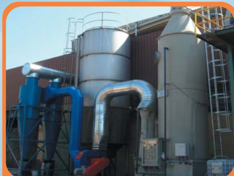
Abbattimento polveri, fenolo, formaldeide da reparto animisteria SHELL-MOULDING Dusts, phenol, formaldehyde treatment from SHELL-MOULDING core-shop department