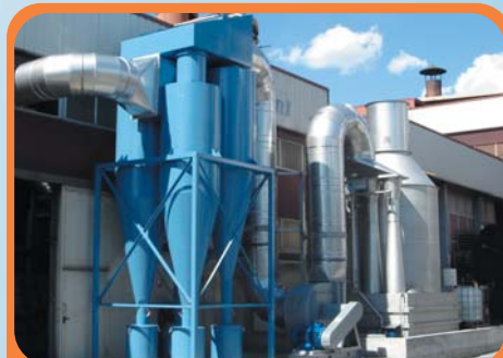
Abbattimento polveri e ammina da reparto animisteria COLD-BOX Dusts and amines treatment from COLD-BOX core-shop department